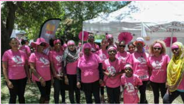
Association Prévention Pei Le Port