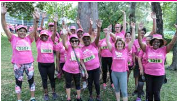
Association Familles Solidaires