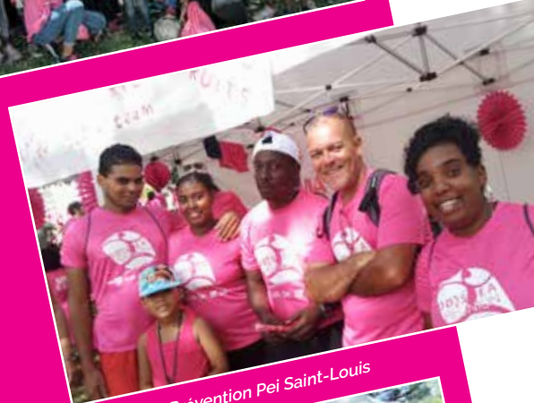
Association Prévention Pei Saint-Louis