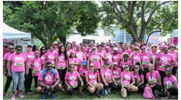
Association La Découverte