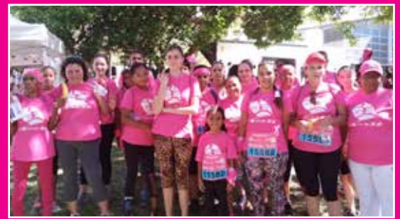
Équipe de Sans Souci