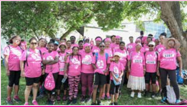
Association Far Far