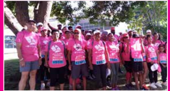
Équipe de Sans Souci