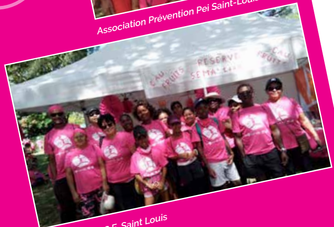
Association A.S.E. Saint Louis