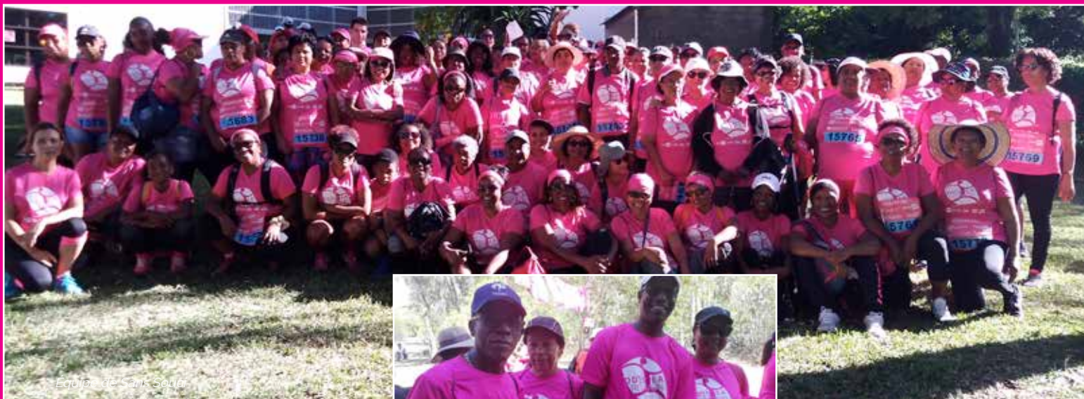
Équipe de Sans Souci