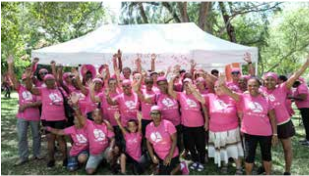
Académie Savate Dyonisienne