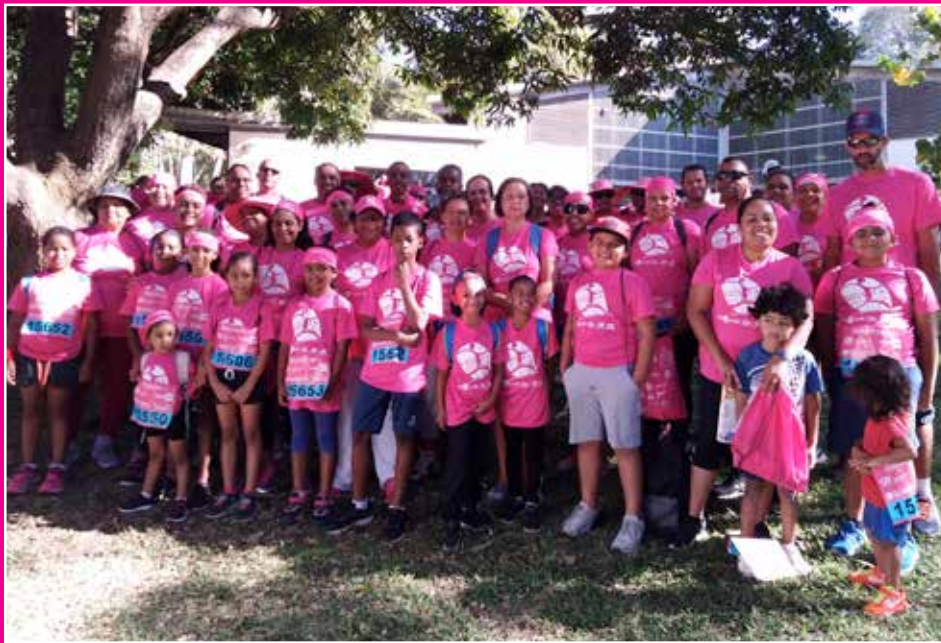
Équipe de Sans Souci