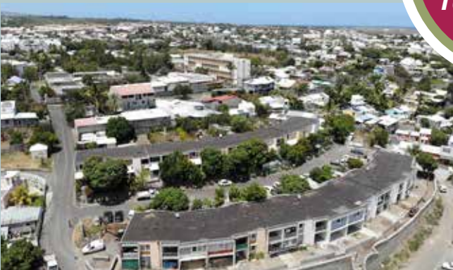
Aquarium, Saint-Louis. 46 logements rénovés entièrement. Un cheminement extérieur donne accès à un jardin privatif, lui-même desservant 12 logements du rez-de-chaussée dédiés aux personnes à mobilité réduite.