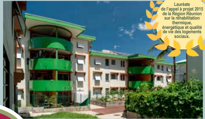
Les Casernes, Saint-Pierre. L'une des trois résidences dont le confort thermique a été optimisé lors des travaux de rénovation.

Lauréate de l'appel à projet 2015 de la Région Réunion sur la réhabilitation thermique, énergétique et qualité de vie des logements sociaux.