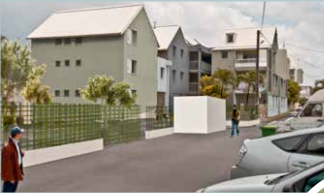
Glycines, Saint-Pierre. Tout le rez-de-chaussée de cette résidence a été restructuré pour aménager des logements accessibles aux personnes à mobilité réduite.