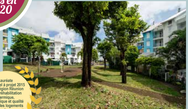
Bois Rouge, Saint-Denis. 164 logements entièrement refaits et rééquipés de ballons solaires. Toutes les pièces d'eau sont neuves (wc, salles de bains, cuisines).

Lauréate de l'appel à projet 2015 de la Région Réunion sur la réhabilitation thermique, énergétique et qualité de vie des logements sociaux.