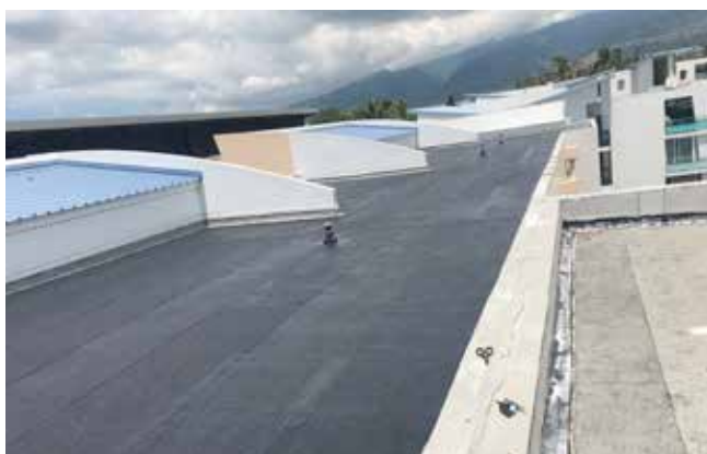
Remplacement de la toiture terrasse de la résidence Caloupilé au Port

représente plus de la moitié des travaux et consiste à réparer ou remplacer des toitures, faire le ravalement des façades, changer des fenêtres et des portes pour arrêter les infiltrations dans les logements.