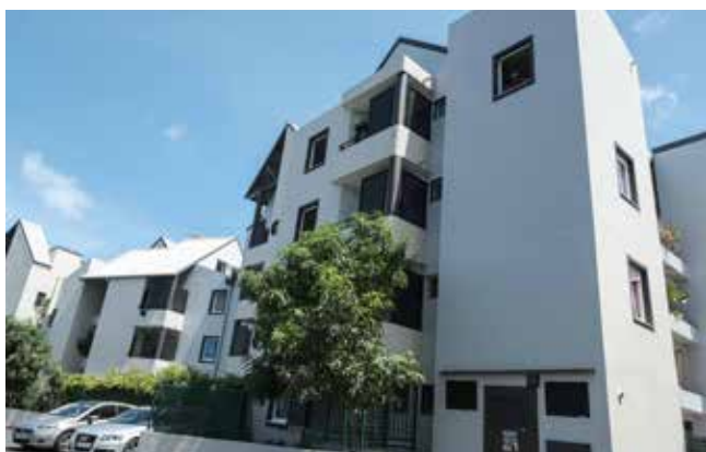
Ravalement des façades de la résidence Belvédère à Saint Pierre