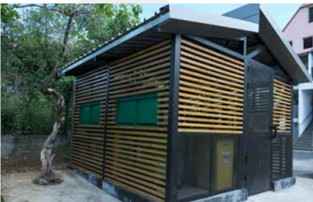
Création d'un local poubelles à Bois de Rose à Bois d'Olives

Les réparations ont notamment consisté en travaux de peinture dans les cages d'escalier et de création de locaux poubelles.