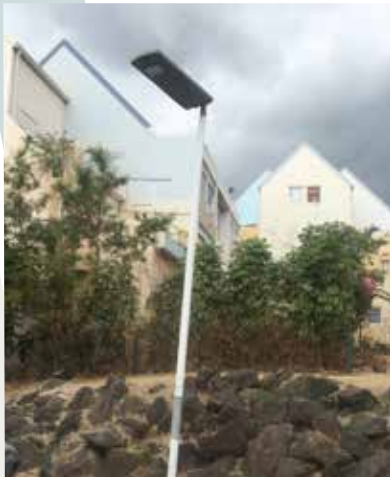
Remplacement des éclairages extérieurs à Saint-Laurent à La Possession

La SEMADER a principalement réalisé des travaux : de réparation des canalisations ; d'électricité (antennes collectives, remplacement des éclairages extérieurs...) ; des travaux de sécurisation (portail, porte de hall, éclairage, électricité) ; de plomberie : colonnes montantes d'AEP pour amener l'eau potable dans les logements.