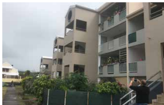
Ravalement des façades de la résidence Terrain Océan à Saint André